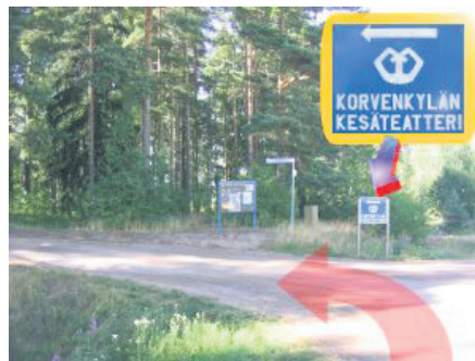
Kappelilta korvenkoululle on matkaa 1,4Km ja niin olet jo perillä. Aja pihaan tai minne liikenteenohjaajat näyttävät.