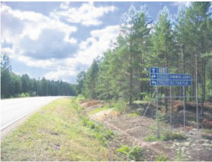
Mikäli olet edelleen jatkanut kääntymättä olet saapunut Muhniemelle.