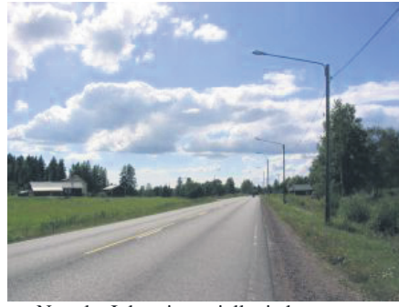
Nyt olet Inkeroisten tiellä, jatka suoraan