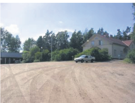
Korven koulu tulosuunnasta katsoen

Korven koulu: Korvenkylän nuorisoseura/ Korvenkylänkesäteatteri Korventie 705 46960Muhniemi Anjalankoski Kymenlaakso Eteläsuomi Finlandtel.0400824854