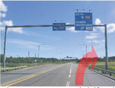
Kouvolan suunnasta saavuttaessa valtatie 15:sta pitkin, aja Myllykosken risteyskien ohi kohti Kotkaa. Käännä Inkeroinen/Elimäki risteyksessä oikealle, eli Inkeroistentielle (numeroltaan 354)