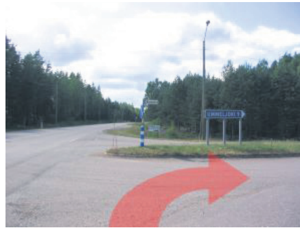
Valtatieltä tähän pisteeseen asti olet ajanut 10Km. Olet jo miltei perillä. Käännä oikealle eli Korventielle (kyltti Ummeljoki)