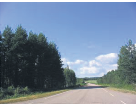
Oikealla puolellasi on nyt hautausmaa, sekä Regina-kappeli. Jatka asfalttoitua-alamäkeä alas.