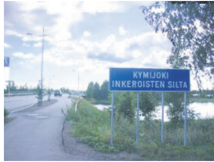
Mikäli et ajanut liikenneympyrässä harhaan, löydät 1,1Km:n jälkeen Kymijoen ylittävän sillan. Aja siitä yli ja jatka kääntymättä läpi Anjalan.